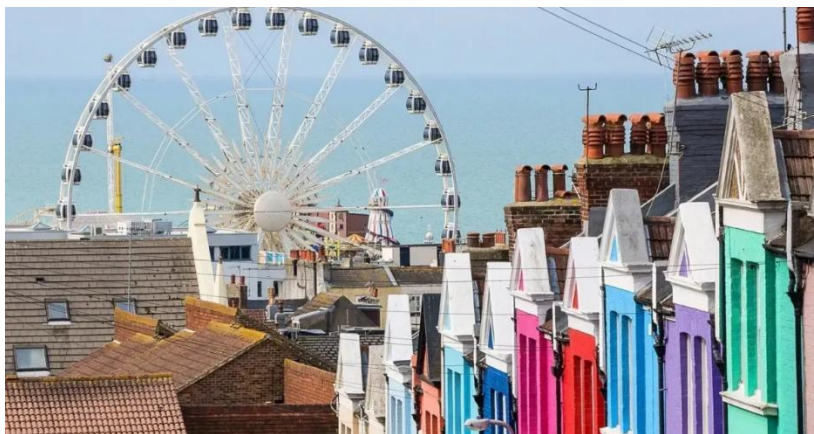
Excursie la Brighton