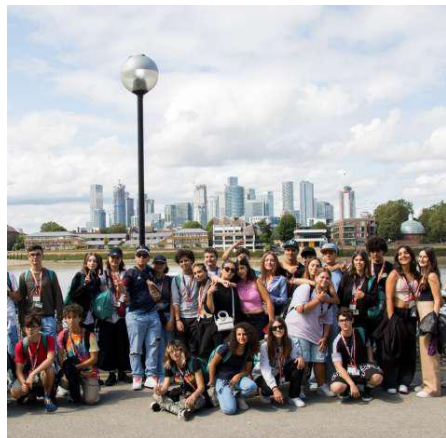
Elevi in excursie la Londra